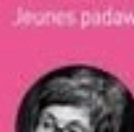
Aude MAUREL Illustratrice

Petit·e·s curieux·ses dès bébé Jeunes padawans dès 6 ans Explorateur·trice·s dès 9 ans Esprits libres dès 12 ans