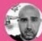
Pascal BRISSY Auteur